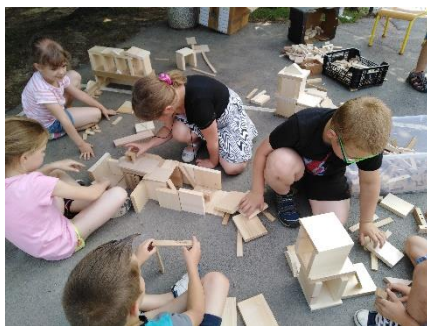
Prvošolci pri likovni umetnosti