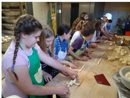
V pekarni Resnik

V nujnih primerih se lahko oglasite kadarkoli med delovnim časom pri svetovalni delavki, razredničarkah ali ravnateljici. Razgovori z razrednikom ali učitelji v času, ko imajo pouk (razen v nujnih primerih), niso zaželeni. Prosimo, da redno obiskujete roditeljske sestanke in pogovorne ure, ker boste samo tako spremljali otrokov napredek v šoli.