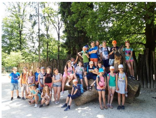
Ekskurzija četrtošolcev OŠ Lesično in OŠ Kozje v Tehniški muzej Bistra in Živalski vrt