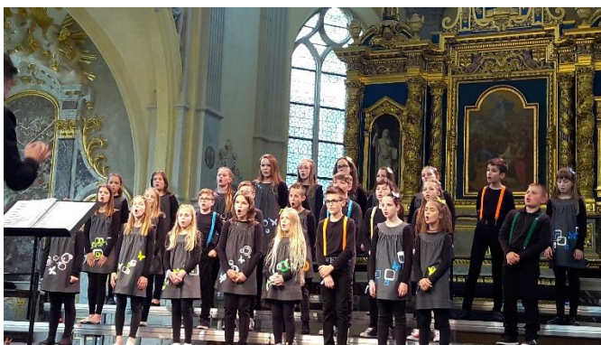
Projektni otroški pevski zbor OŠ Lesično in OŠ Planina pri Sevnici na tekmovanju v Franciji