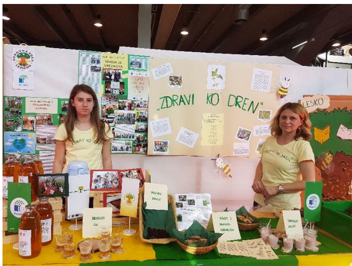
Predstavitve projekta Ekošola kot način življenja na sejmu Altermed v Celju