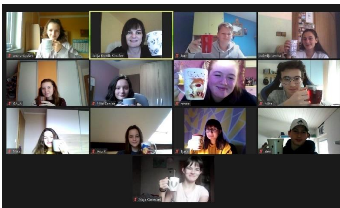
Predbožična čajanka preko ZOOM-a

V nujnih primerih se lahko oglasite kadarkoli med delovnim časom pri svetovalni delavki, razredničarkah ali ravnateljici. Razgovori z razrednikom ali učitelji v času, ko imajo pouk (razen v nujnih primerih), niso zaželeni. Prosimo, da redno obiskujete roditeljske sestanke in pogovorne ure, ker boste samo tako spremljali otrokov napredek v šoli.