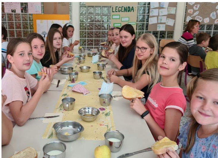
Tradicionalni slovenski zajtrk