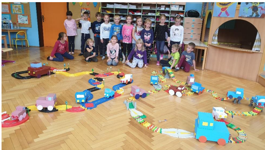
Tehniški dan – 1. razred

Srebrno priznanje za dosežen uspeh na državnem tekmovanju iz matematične logike je prejel Jakob Šergon iz 2. r., pod mentorstvom Polone Čepin.