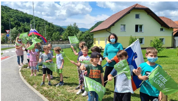
Kolesarska dirka 2021