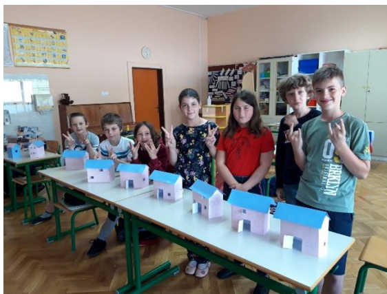
Izdelali smo našo šolo