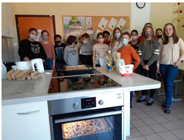
Peka biskvita z gozdnimi sadeži